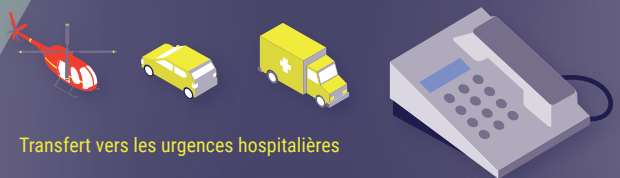
Transfert vers les urgences hospitalières

Gardez votre calme et soyez prêt-e à répondre aux questions qui vous seront posées.